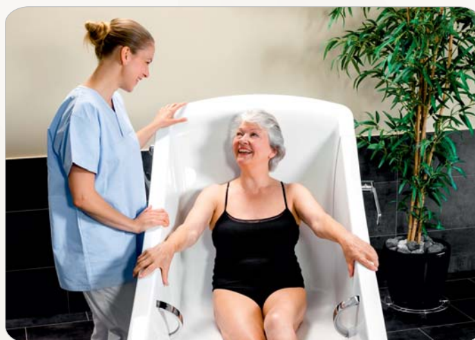
Komfortabler Innenraum mit viel Platz im Schulter- und Gesäßbereich

Die ergonomische Innenform und der häusliche Charakter der Wannenform bieten insgesamt einen beschützenden Charakter für den Badenden und erhöhen dadurch deutlich das Wohlbefinden.