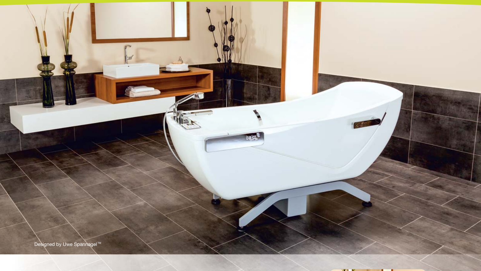
Designed by Uwe Spannagel™

Die klaren und weichen Formen der Wanne erinnern an moderne, zeitgemäße Privatbäder und fügen sich vollkommen in das bestehende Wellness- und Badekonzept der Einrichtung ein. Die Funktion wurde in enger Zusammenarbeit mit Fachkräften aus der Pflege und Therapie optimiert und an die Erfahrungen aus der Praxis angepasst, dies verschafft dem Badenden und dem Pflegepersonal ein Maximum an Sicherheit und Komfort für ein wunderschönes Baderlebnis.