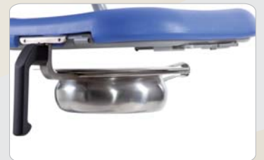
9 Optional: Halter für Steckbecken zur Aufnahme Ihres hauseigenen Steckbeckens.