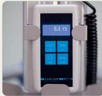
6 Optional: Digitale Patientenwaage, nicht geeicht.