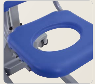
7 Sitzfläche mit großer, verschließbarer Pflegeöffnung.