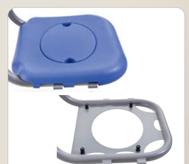
11 Die PUR-Auflage wird einfach auf den Edelstahlrahmen aufgeschoben und ist jederzeit abnehmbar.