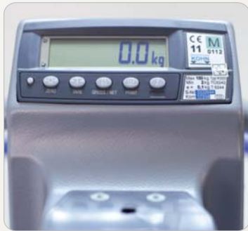
5 Optional: Digitale Patientenwaage, geeicht.