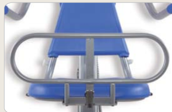
8 Optional: In die Halterung am Sitz einsteckbares Seitengitter mit Sicherheitsverschluss.